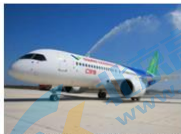
2023年5月，国产大飞机C919开启首次商业飞行