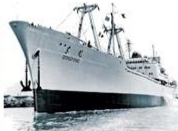
1960年，中国自行设计、建造的第一艘万吨级远洋货轮——“东风号”下海