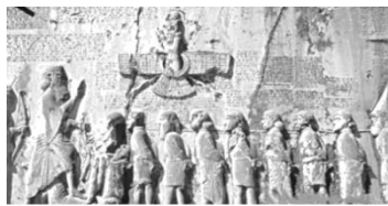
贝希斯敦浮雕及铭文

提及。1835年英国考古学家罗林森在今伊朗发现的“贝希斯敦铭文”（波斯君主大流士一世为了颂扬自己功绩而镌刻），标注了20个行省，其中包括了犍陀罗行省（古代印度列国之一）。这主要说明（ ）