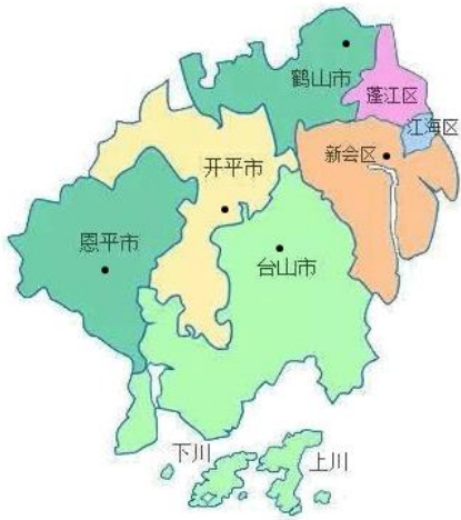
广东省五邑地区示意图

材料二 碉楼是具有防御性的多层塔楼式乡土建筑。开平是“中国的碉楼之乡”，现存的碉楼有 1833 座，大规模的兴建在清末民初。侨眷相对富裕的生活被土匪觊觎，华侨成为建设碉楼最积极的力量。碉楼最多的是采用进口的钢筋混凝土材料和外国建筑技术建造的，在全国其他乡村地区极其少见。从古希腊、古罗马建筑，到拜占庭和哥特式建筑，一直到文艺复兴时期的欧洲建筑、资本主义革命时期的建筑，都可以在开平碉楼中找到它们的影子。很多碉楼将中式的“喜”“福”“寿”“禄”字形，荷花叶、中国结等图案，糅合于外墙的装饰中。在各村中，最漂亮的碉楼往往是居楼。卧室、书房、卫生间、厨房等功能用房齐全，有的居楼还安装了供水系统、消防系统。