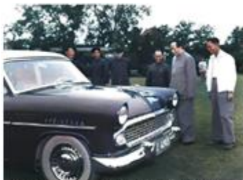
1958年5月，毛泽东在中南海观看新中国制造的第一辆小轿车——“东风”牌小轿车