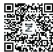
BJUT 艺设学工 微信公众号