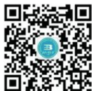
北京工业大学 招生办公室