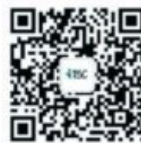
北工大信息化 微信公众号