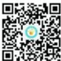
北工大资助中心 微信公众号

3. 学生资助中心将于7月15日-9月15日（工作日8:00-12:00, 13:30-17:00）开通学生资助相关事宜咨询热线，欢迎同学致电咨询。咨询电话：010-67392607。