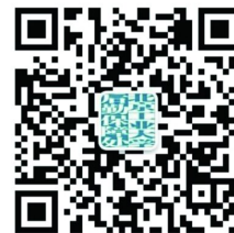
北工大后勤 微信公众号