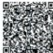
艺设 2023 级 新生 QQ 群

5、欢迎了解学院教育教学相关事宜，也可添加“北工大艺视界”学院官方微信公众号了解学院最新动态。