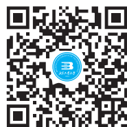
北京工业大学 官方微信订阅号