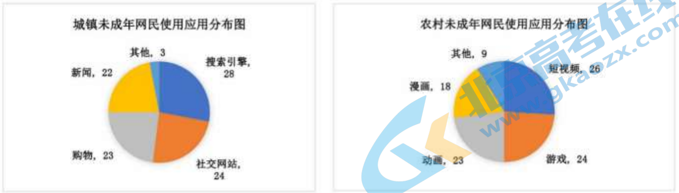
(图 1) 2021 年城乡未成年人网络应用对比图

成年网民使用社会属性较经的应用较多，而农村来成年网民更偏好于使用休闲娱乐类应用。