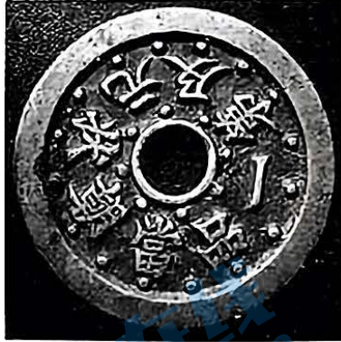
状元及第 一品当朝