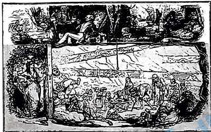
漫画《穷人国和富人国的写照》

材料一 下图为发表于1843年英国《笨拙》杂志的漫画《穷人国和富人国的写照》。该画还为资本家设计了一句道白:“尽管说煤窖里的境遇仍相当悲惨,但它也带来了许多奢华与享受,了解这一点也就可以让人欣慰了。”