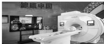
自主研发的磁共振成像装