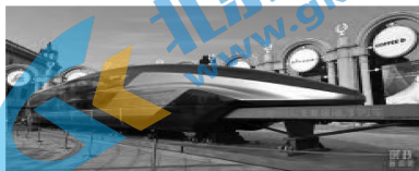
时速600公里高速磁浮列车