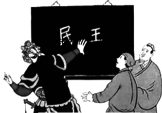
我就是民主少一点

8. 2021年7月21日至23日,习近平来到西藏,祝贺西藏和平解放70周年,看望慰问西藏各族干部群众。2019年底,西藏74个贫困县区全部摘帽,62万多贫困人口全部脱贫。农牧民群众生活实现了从水桶到水管、从油灯到电灯、从土路到柏油路的大变化。上述材料说明