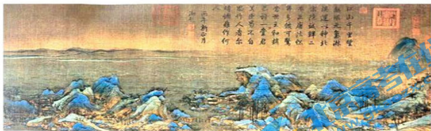
图 10 故宫博物院收藏《千里江山图》局部