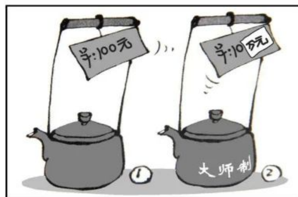
《摇身一变》 作者:王铎

6. 为应对新冠肺炎疫情对经济社会的不利影响,某市发放了普惠型和红利型两种消费券。普惠型消费券人人有份;红利型消费券只对低保、特困等四类救助对象发放。发放红利型消费券