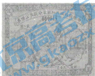
图5 中华苏维埃共和国发行的公债券