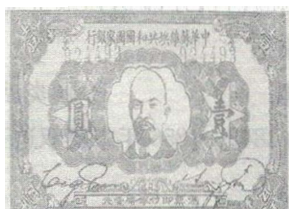
图6 中华苏维埃共和国发行的货币

图3—6是选自1931—1933年中华苏维埃共和国的一些史料和文献图片。从材料中选取两张相关联的图片并结合所学知识,解读中华苏维埃共和国的政策。(8分)