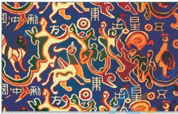
“五星出东方利中国”织锦(局部)