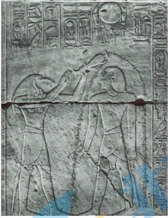
埃及神庙刻有象形文字的壁画