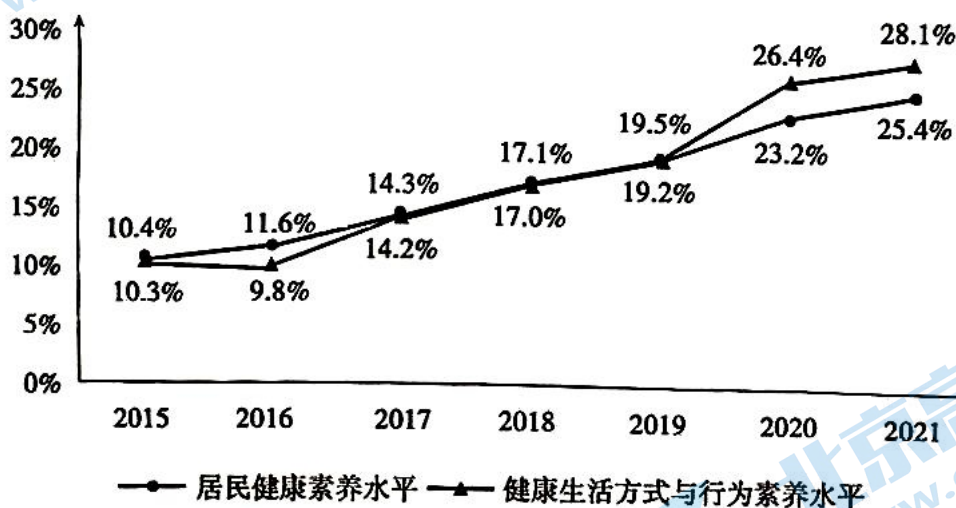
图2 2015至2021年中国居民健康素养水平(数据来源:公开资料,人民数据研究院整理)