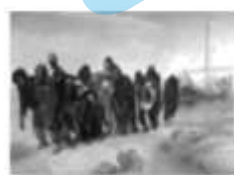
B. 《伏尔加河上的纤夫》