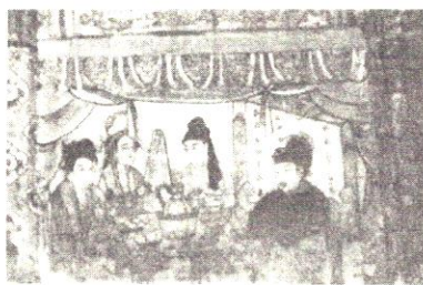
图 2 白沙宋墓二号墓西南壁