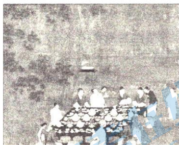
图 4 （北宋）徽宗赵佶《文会图》（局部）