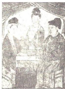
图 3 唐庄宋代壁画墓 M2 西北壁