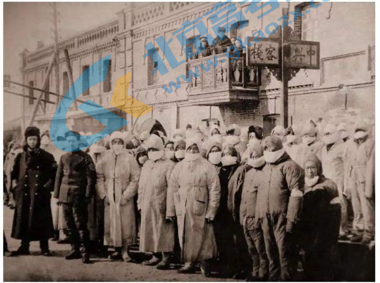
哈尔滨, 停业的客栈、学校被用做防疫办公室、消毒室和病房, 1911 年

依据材料并结合所学, 概括清末东北鼠疫病情得以控制的主要措施。评价伍连德的历史贡献。