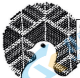
图3 不结盟运动会标

成员国/个： 1963年75 1979年120 1983年125 2023年134