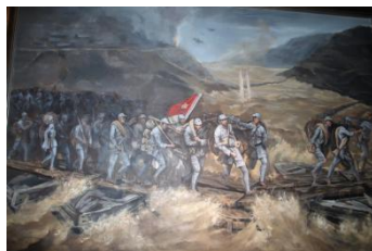
图 20 四渡赤水