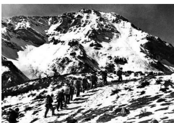
图 21 翻越雪山图