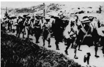
图 19 第五次反围剿失利图