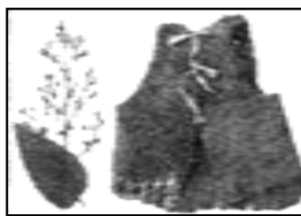
图 22 吃的野菜和穿的蓑衣