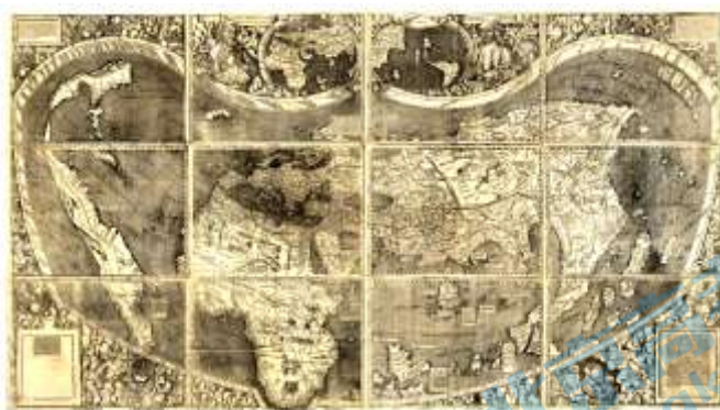
1507年德国地理学家瓦尔德泽米勒 绘制的《世界地图》

赫里福德《世界地图》被称为“历史”。其顶端是圣经中耶稣复活和审判的整个场景。世界被分为欧洲（地图左下方）、亚洲（上方）、非洲（右下方）三个部分。以东为上位，中央是耶路撒冷，耶稣受难的画面被绘在城市上方，圣城用圆形的城墙表示，很像一个巨大的神学齿轮。越往地图上方看，聚落分布得越稀疏，长相奇特的怪物和人像也开始渐渐出现。地图底部的一座岛屿矗立着两根圆柱——赫拉克勒斯之柱，标志着古代已知世界的最西端。