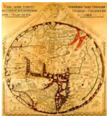
保存于英国赫里福德教堂的 《世界地图》，创作于1300年