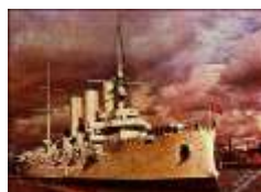
《共产党宣言》书影 巴黎公社遇难者纪念墙 阿芙乐尔号巡洋舰