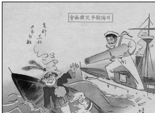
《日清战争笑乐画会》（日本人绘制）