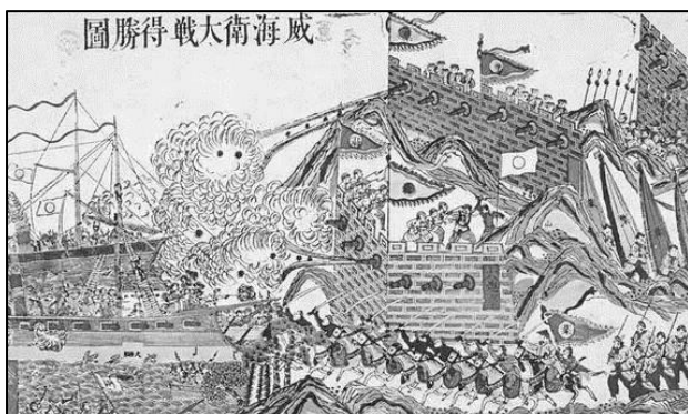
《威海卫大战得胜图》（清朝人绘制）