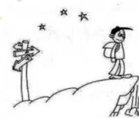
如果方向错了，停止就是进步