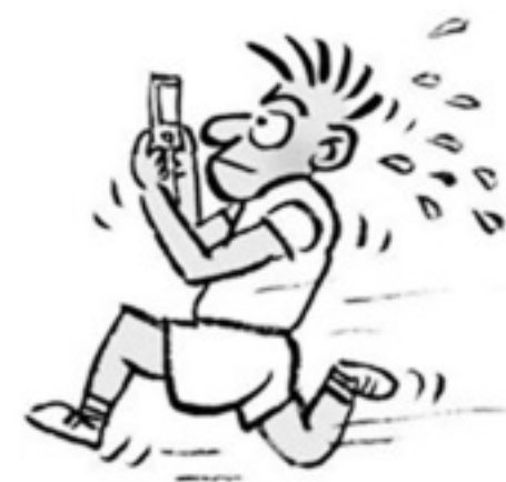
专家说走路不能玩手机 吓得我现在都是跑着玩手机了

23. 电视剧《觉醒年代》展现了从新文化运动、五四运动到中国共产党建立这段波澜壮阔的历史画卷,艺术地再现了一百年前中国的先进分子和一群热血青年演绎出的一段追求真理、燃烧理想的澎湃岁月,深刻地揭示了马克思主义与中国工人运动相结合和中国共产党建立的历史必然性。这表明