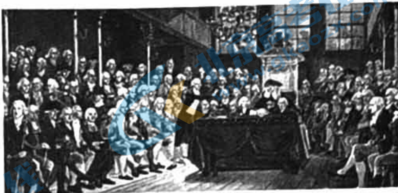
图② 18世纪中叶的英国议会下院

图②描绘的是下院开会的情景。整个下院仅四人有固定座位：议长席由下院议长专用，首相和反对党领袖也享有专座，最后是为下院任期最长的议员专设的“下院之父”席。议长席设在大厅一端正中间，其正下方是演讲台，在演讲台两边各有八排长靠椅，右边由政府大臣和执政党议员就座，左边是反对党议员的议席。