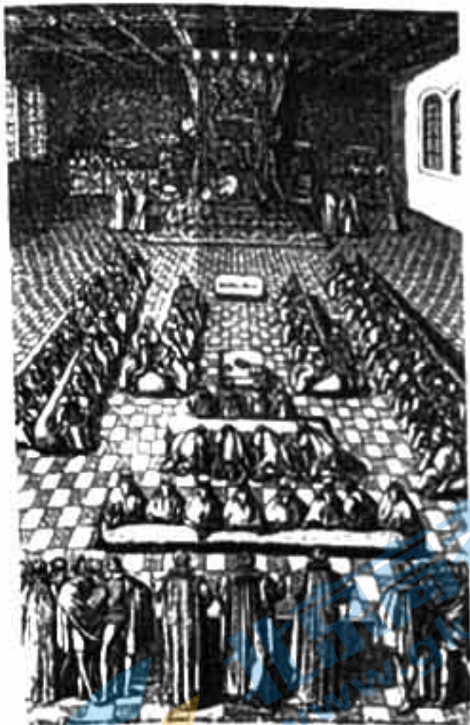
图① 16世纪伊丽莎白一世主持议会