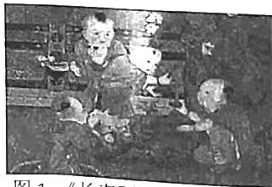
图 1 《长春百子图》（局部）

4. 宋代画家苏汉臣绘制的《长春百子图》是一幅婴戏图，用花表示万代长春之意，因而得名“长春”，“百子”即表示有很多孩子，画面主要以儿童游戏为内容（如图 1）。该作品