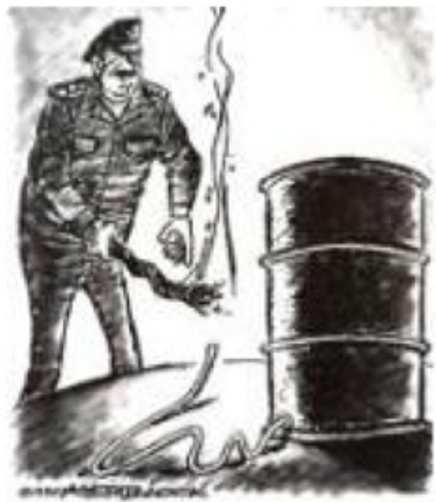
图1 欢迎来到后冷战时代

漫画中的人物是时任伊拉克总统萨达姆·侯赛因，他举起火把，正在点燃连接油桶的引线（注：1991年美国发动了对伊拉克的海湾战争）据此可知，对该漫画解读正确的是（ ）