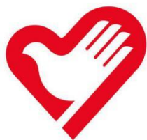
中国青年志愿者标志

中央的支持下，志愿服务的渠道不断拓宽。2003年，大学生志愿服务西部计划全面启动；2008年，170万名青年志愿者参与了北京奥运会和残奥会的服务工作；2020年，中国青年志愿者赴“一带一路”沿线国家开展国际志愿服务……从我国志愿服务的发展历程中可以看出，古今对于志愿者的称呼虽有不同，但其精神内涵却始终如一。