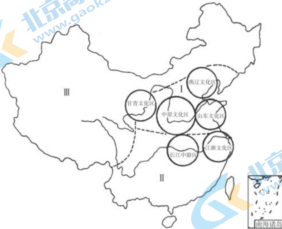
中国新石器文化的分区