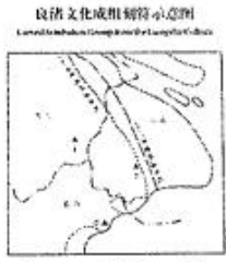
良渚文化成组刻符示意图