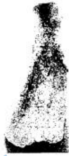
牛角胛骨,现存甲骨文 63 字,分属 11 条卜辞,主要卜问对先祖举行祭禘的方式