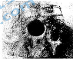
良渚文化出土的神人纹玉琮