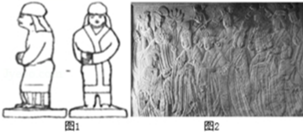
图1山西大同汉人宋绍祖墓壁画中的人物服饰，垂裙帽、圆领或交领长褶、束腿裤为胡服特点；图2河南龙门石窟《帝后礼佛图》中，鲜卑贵族身穿宽袍大袖为汉服特点。