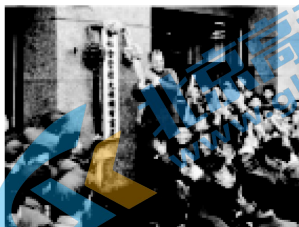
②上海信大祥绸布商店挂上公私合营的招牌