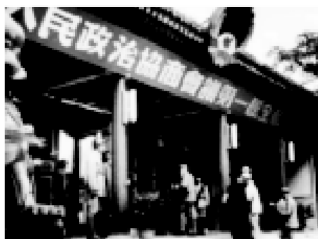
④中国人民政治协商会议第一届全体会议召开