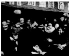
①农民踊跃报名加入农业生产合作社