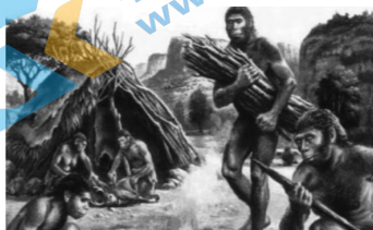
“北京猿人”使用的石器