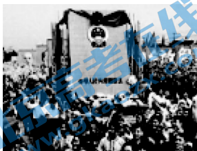
③新中国第一部宪法诞生