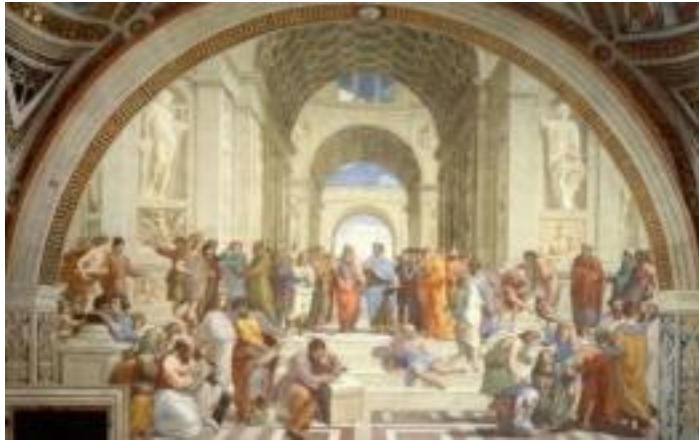
图二：拉斐尔《雅典学院》

18—19 世纪，透视法仍然受到很多艺术家的尊崇，不断丰富和发展。随着 19 世纪摄影技术的发明和改进，通过绘画还原现实的任务逐渐让位于照相机。此后出现了一些体现新的追求和理念的绘画流派，开辟了绘画艺术的新天地。