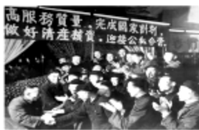
图一: 资本主义工商业迎接公私合营