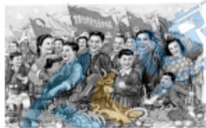
图二: 农业合作化生产步步高