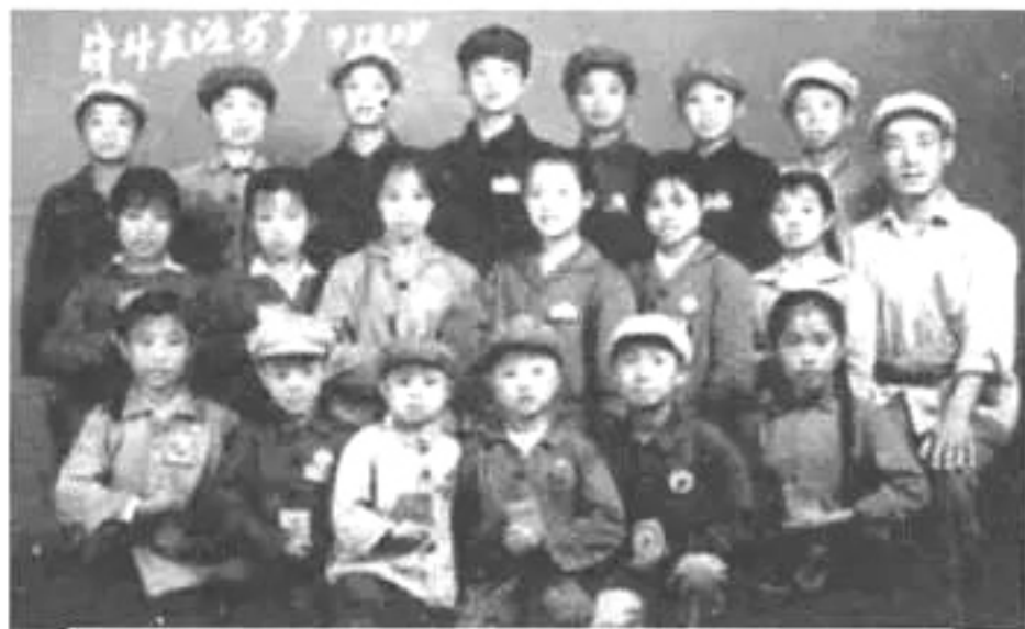
20世纪六七十年代“军装”热