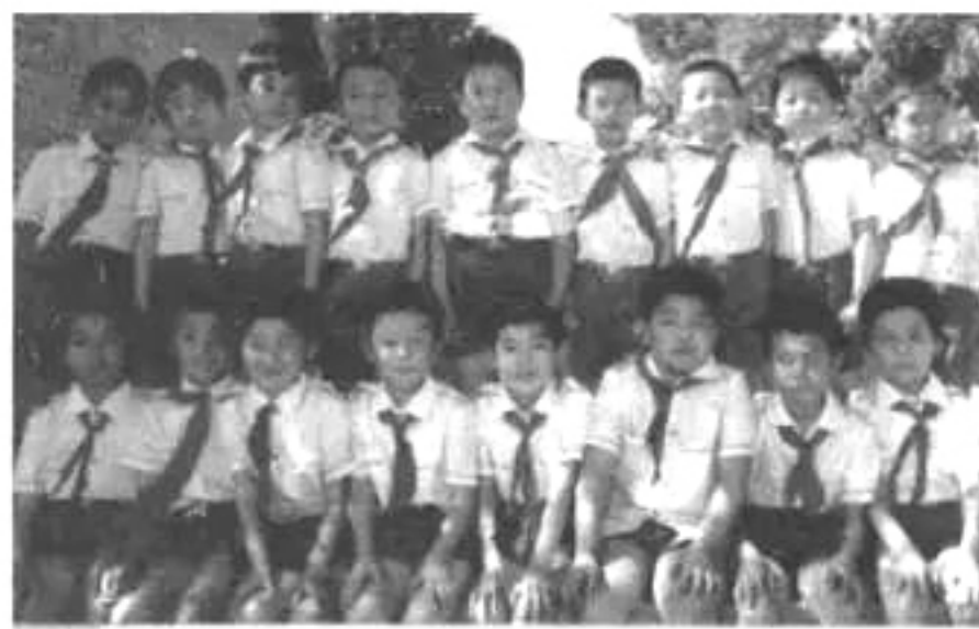
20世纪八十年代白衬衣海军装