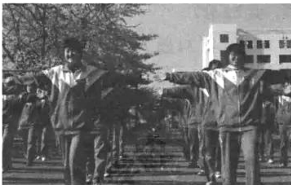
20 世纪 90 年代宽松运动装