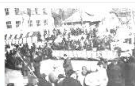
青岛市各界 11 万人在汇泉广场举行盛大集会，庆祝社会主义改造伟大胜利