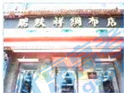
创建于济南的老字号瑞祥绸布店，在 1954 年底响应国家号召，率先实现公私合营

19. 某班组织学生开展研究性学习，确定的主题是“新中国峥嵘岁月——社会主义改造”。围绕这一主题同学们共享了一组图片。通过这些图片和所学知识，可以感悟到（ ）