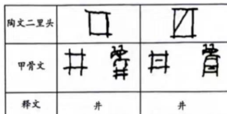
表 1 二里头陶文与甲骨文对照表