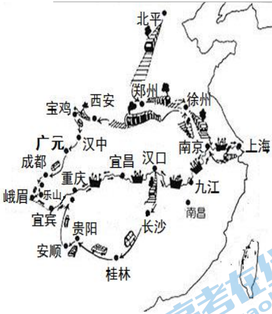
图国宝文物迁移图