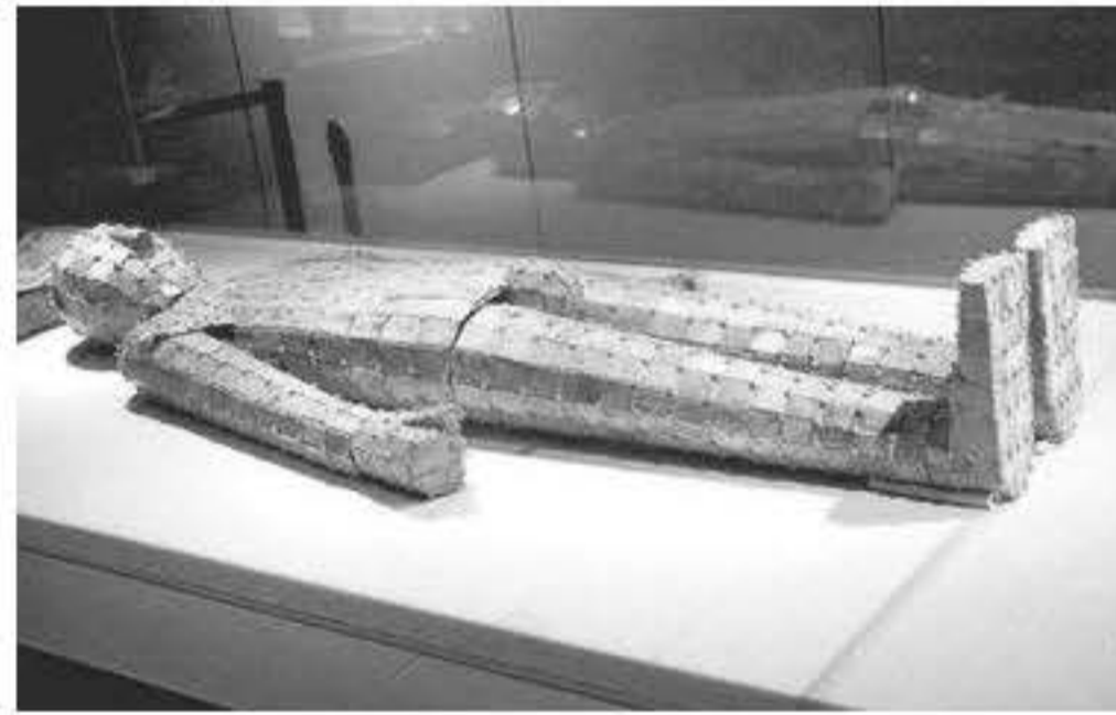
满城汉墓（刘胜墓）出土的金缕玉衣