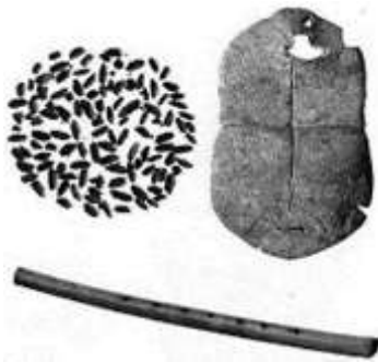
贾湖遗址出土的碳化稻粒、刻符龟甲和骨笛