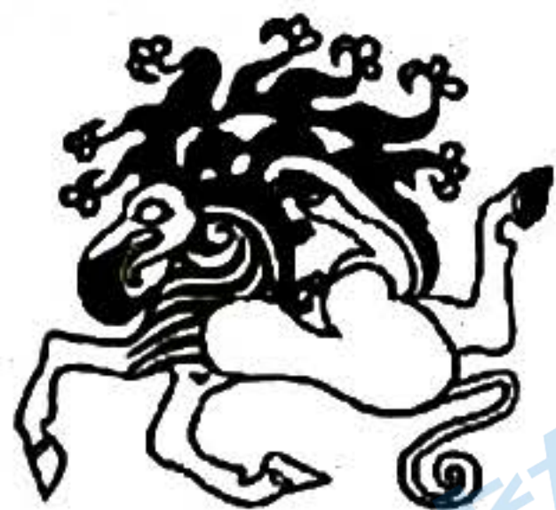
图1 出土于南西伯利亚地区 (前 5-4 世纪)