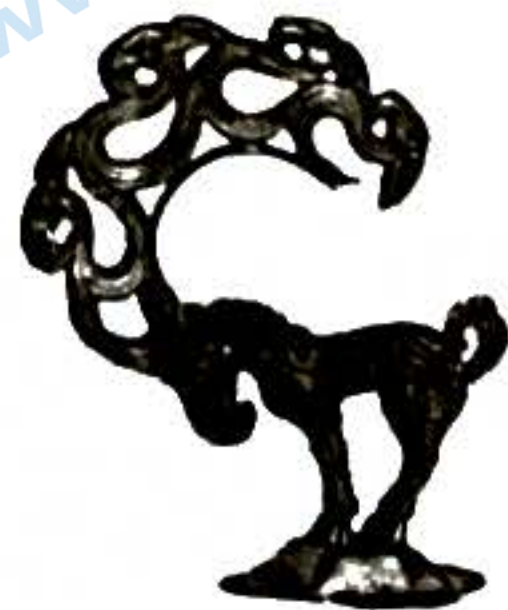
图3 出土于陕西神木 (战国时期)