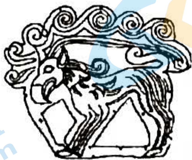
图2 出土于内蒙古鄂尔多斯 (战国时期)