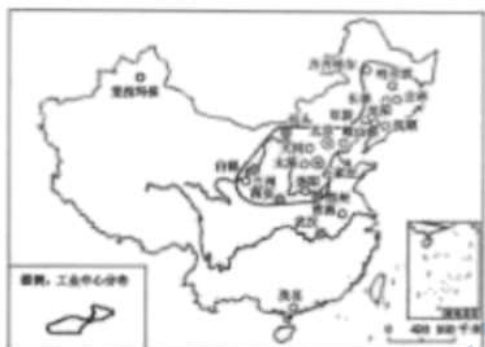
主要工业中心分布示意图 1

9. 工业布局对于各地区乃至全国经济发展有着十分重要的意义，新中国成立后工业布局发生了巨大的变化，下图中工业布局调整的原因为