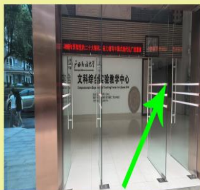
六：进入文科综合实验培训中心右上角