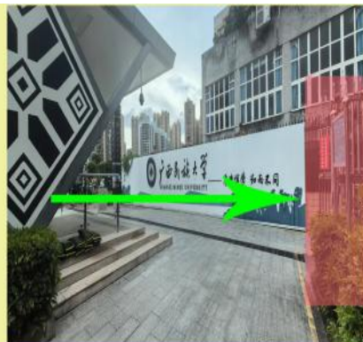
二：D出口边有个铁门