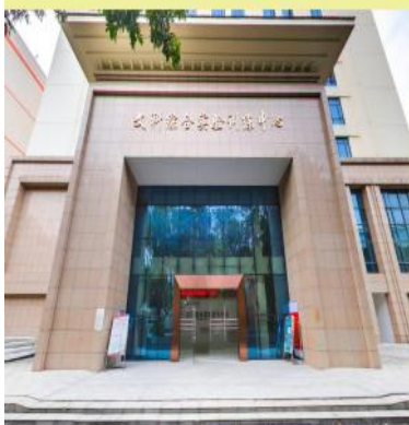
五：找到文科综合实验培训中心大楼