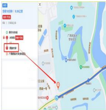
一：乘坐地铁一号线到民族大学下站