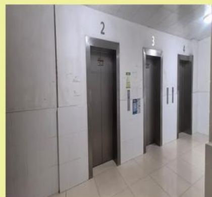
七：找到电梯口乘至15层