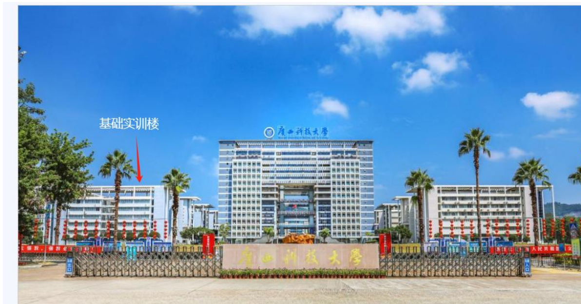
(广西科技大学南门)