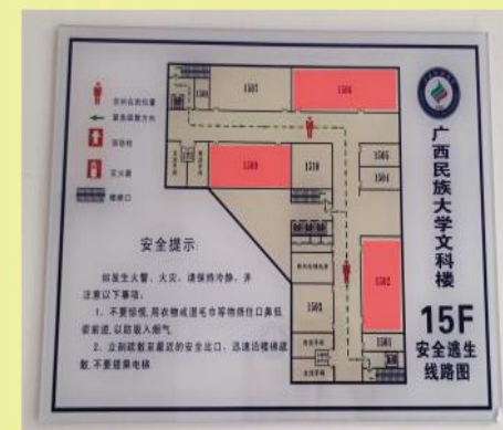
八：找到自己的考场1502/1506/1509室进入考场