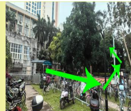
四：直行第一个路口左拐