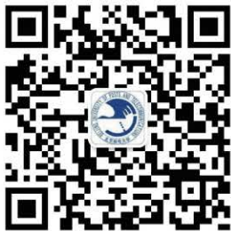
北京邮电大学学生处官方微信

具体资助政策可以关注“北京邮电大学学生处”官方微信，“北京邮电大学资助中心”官方微信，查询相关信息。