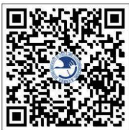
(北京邮电大学缴费二维码)

1、手机微信扫描缴费二维码——进入【统一支付平台】——输入学号、密码（身份证后6位）登录。