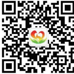
北京邮电大学资助中心官方微信