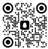
管理科学与工程学院