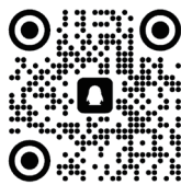
体育经济与管理学院