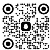
少数民族预科班(北京学院)