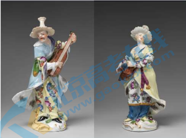
釉上彩中国乐师像（18世纪）

材料二：清康熙年间开始出现珐琅彩瓷，以中国传统白瓷胎为底，融入西方珐琅彩描绘制作而成。珐琅彩瓷装饰题材与风格亦受西方影响。